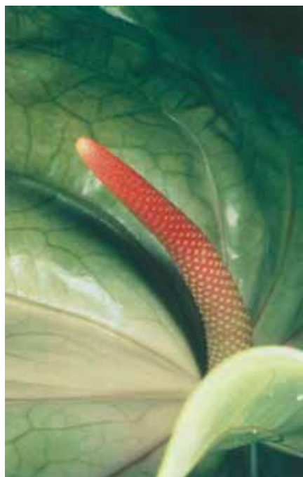
Nobuyoshi Araki , Sans Titre , extrait de la série Vaginal Flowers , 1999.

On pense alors à Araki pour qui photographier le sexe revient à photographier la mort. D'abord celle de sa femme qui sert de matrice à toute l'œuvre et ensuite celle de ces corps féminins véritablement disséqués par l'objectif, abandonnés à la représentation et au deuil de l'artiste.